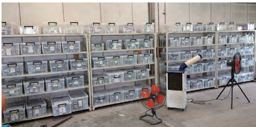
クラウドサービス導入をきっかけに整理された在庫棚