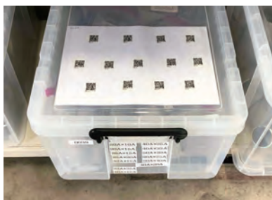
部品の在庫ケース (QRコードによる分類)