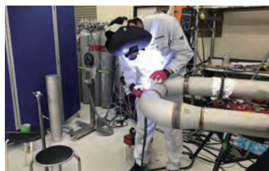
配管製造の作業風景

スマートフォンのアプリを利用してQRコードで入庫・出庫が簡単に管理できる小規模事業者向け在庫管理クラウドサービスを導入。数百種類の在庫が、正確かつリアルタイムに把握可能となり、誤発注や時間ロスの削減が実現し、生産性が向上した。